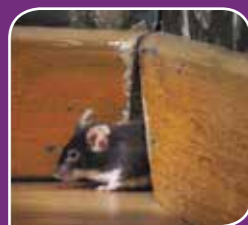
Domača miš ( Mus musculus )