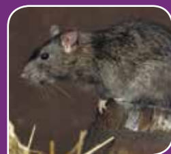
Siva podgana ( Rattus norvegicus )

Podgane in miši so problem v mestnih, primestnih in podeželskih območjih. Kjer koli živimo ljudje bodo, ob ustreznih pogojih, prisotne tudi podgane in miši, ki pa lahko s svojo prisotnostjo, kontaminirajo hrano in krmo, širijo bolezni in povzročajo gospodarsko škodo.